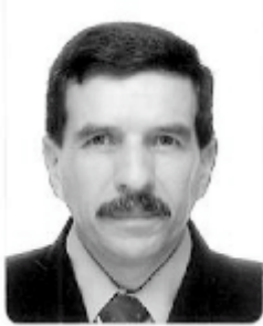
MG © RICARDO RUBIANOGRUOT ROMÁN Miembro de Centro Colombiano de Pensamiento Político Militar