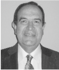
Por: MG. VÍCTOR ÁLVAREZ VARGAS