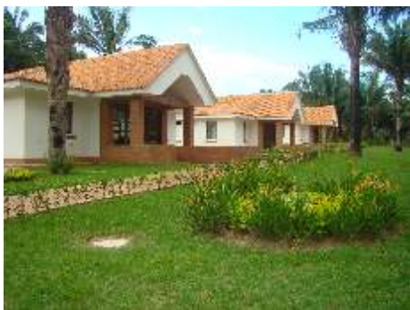
Una mirada al barrio General Paría, ubicado en el Centro Vacacional Las Mercedes, Nilo (Cundinamarca)

Alineados con el modelo corporativo diseñado por el Viceministerio del Grupo Social y Empresarial del Sector Defensa (GSED), el Club Militar se ha propuesto desarrollar dentro de su horizonte 2011-2014, la meta MEGA, una ambiciosa estrategia para estimular el progreso empresarial, un reto, un compromiso con nuestros socios y beneficiarios, que lograremos materializar con la adquisición de una nueva sede ubicada en la zona Caribe de nuestro país.