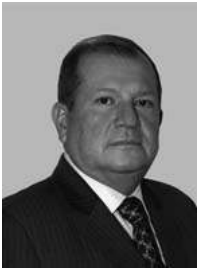
BRIGADIER GENERAL ISMAEL SILVA MÁSMELA*