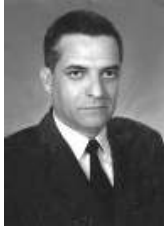
MAYOR GENERAL HENRY MEDINA URIBE