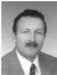
BRIGADIER GENERAL HECTOR MARTÍNEZ ESPINEL

La guerra asimétrica demanda la utilización de técnicas, equipos, tácticas y estrategias no convencionales por parte de grupos minoritarios que atacan a un Estado legalmente constituido; también se utiliza en enfrentamientos entre países con grandes diferencias en sus capacidades y en áreas indeterminadas, con propósitos y objetivos definidos.