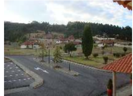
Aspectos de la zona de cabañas del Centro Vacacional Sochagota (Paipa)

Con recursos presupuestales propios de la entidad, provenientes del aporte de nuestros socios a través de las cuotas de sostenimiento y con la operación comercial que desarrolla el Club Militar en sus cuatro líneas de negocios (alimentos y bebidas, eventos, alojamiento, recreación y deportes), la institución pondrá en marcha en 2010 una serie de proyectos dirigidos a la remodelación, modernización y adecuación de la Sede Principal y los centros vacacionales Las Mercedes (Nilo, Cundinamarca) y Sochagota (Paipa, Boyacá), de acuerdo con un Plan estratégico previsto por las directivas de la entidad.